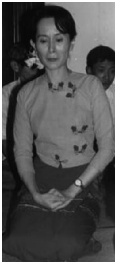
Aung San Suu Kyi

Sinna mungdan na Sum Tsan kasa langaimi tsun ai rai yang Suu Kyi gaw Myen hpyen du kaba