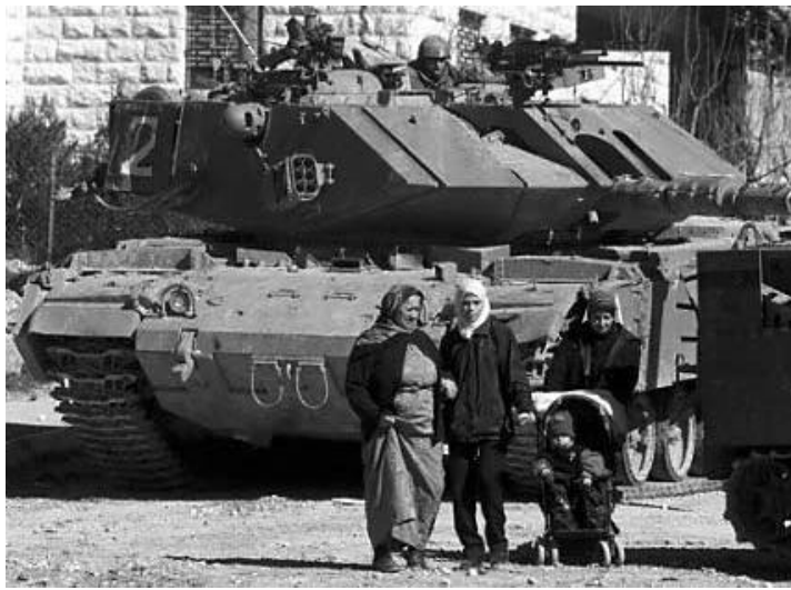
Isare Hpyen mawdaw shawng hku Parletsten Hpawmi ni tsap nga ai sumla

Dai aq shawng shani hta mung Isare hpyen nbungli ni gaw Parletsten Shim lam daju rung hpe gasat wa ai rai nna marai mi si hkum sha ai rai nga ai. Isare hpyen Nbungli F-16 ni gaw bawm hte gap jahkrat wa mat ai re lam hpe dai shaloi mu ai wa langaimi hku na tsun dan wa ai.