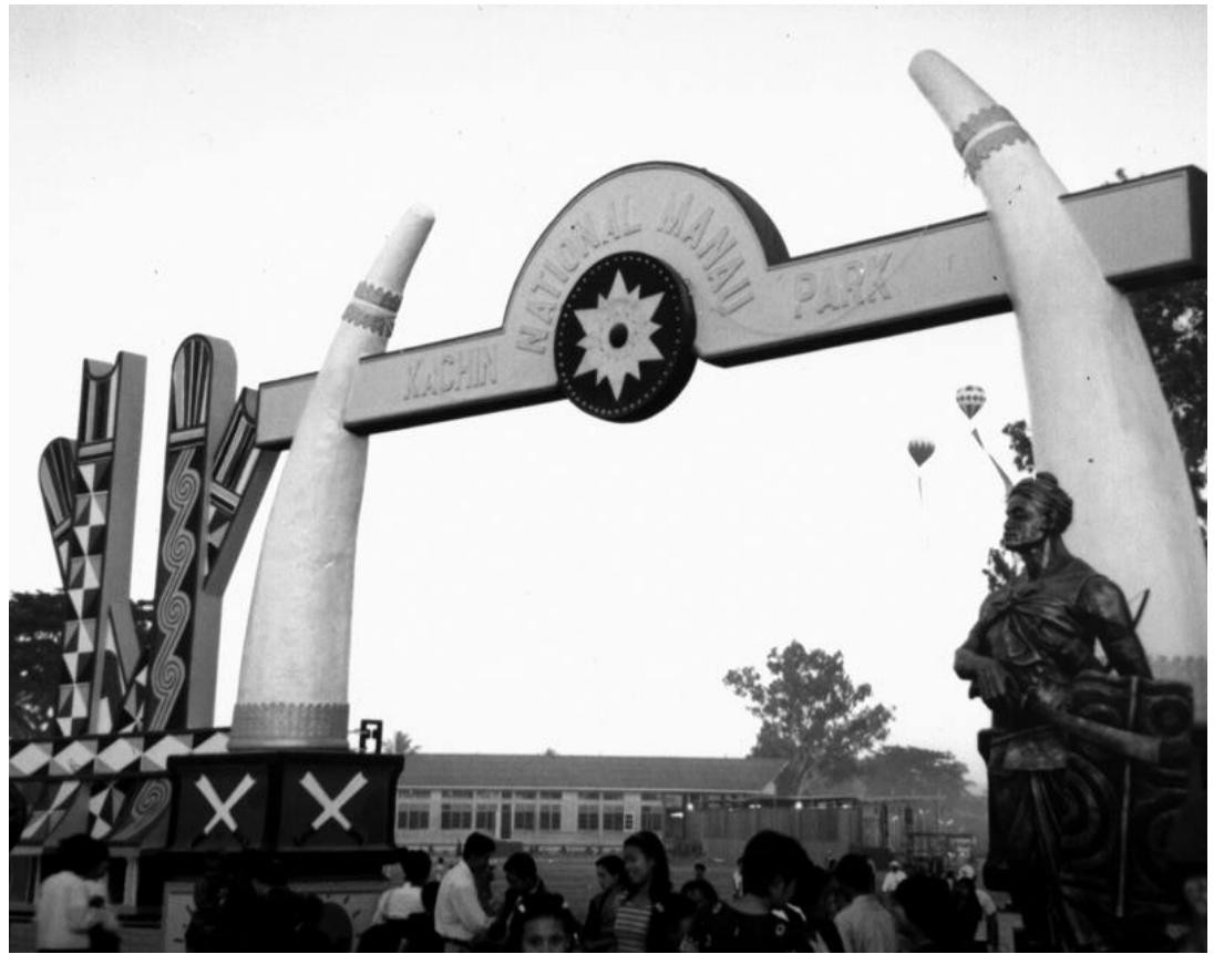
Wunpawng Ninggawn Hkumra Manau Poi kaba aq Chyinghka lam kaba langai rai nga ai. Dai Chyinghka lam hku 2001 ning December shata 26 ya shani kaw na 2002 ning January shata 2 ya shani du hkra galaw ai Manau poi laman mung chying sha Sen lam kahtap na lai shang mat wa sai rai nga ai. Manau wang gaw Sinpraw, Sinna, Ding dung hte Dingda maga de yawng man yawng nna Chyinghka lam kaba mali waw da ai rai nga ai.

Dai lung seng maw ning nan gaw Sagain Munung daw Hkamti mare ginwang kaw re nna Jinghapw mung daw na Lung Seng Pru ai Hpakan maw hte grai ni ni htepai ai sha ra rai nag ai. Raitim dai shara gaw Jinghpaw mung daw uphkang ai npu kaw nre ai majaw dai shara kaw lung seng htu lu na ahkang hte seng nna gaw ya du hkra nchyoishi ai lam hte dai sha ra kaw pru na lung seng mung Hpa Kan ga na zawn kaja na nkaja na hpe mung kadai nlu chye shi ga ai. (NMG)