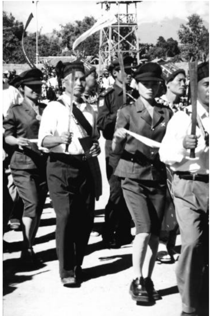
Myitkyina Majoi Wunpawng Ninggawn Hkumra Manau poi kaba hta Shanglawt Hpyen num ni hking hte shang lawm kamanawt nga ai rai nga ai. Dai shara gaw mungkan hta kaba dik htum ai Manau shingra rai nna dai kaw shaning shagu dalam Manau poi hpe galaw lai wa sai rai nga ai. N dai Manau shadung hte Manau wang hpe gaw laiwa sai lahkawng ning dalam kaw na myusha yawng aq masat dingsat langai byin tai wa na matu shagreg gaw gap wa ai rai nga ai.

Manau Poi nnan hpaw ai shaloi Myen hpyen du Hkin Nyunt hte shi aq malawn ni lung ai lam chye lu ga ai. (Kachin Post)